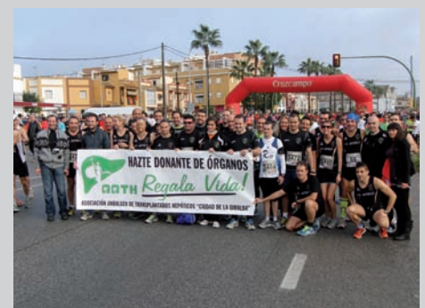
Club Deportivo Los Jartibles