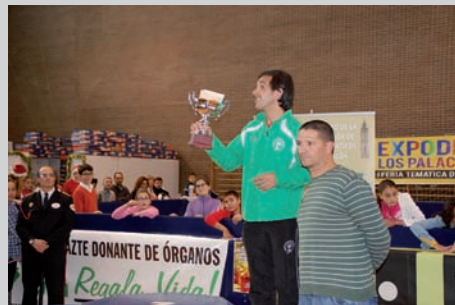
1º clasificado disminuido físico.