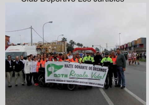
Protec.Civil y Pol. Local de Los Palacios