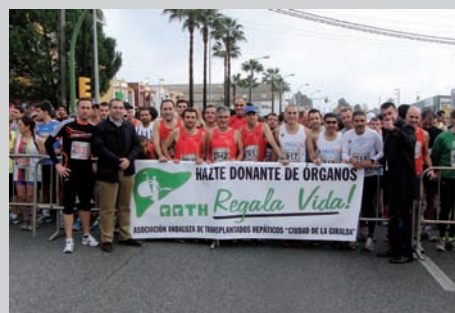
Alcalde y Concejales de Cultura y de Deporte.