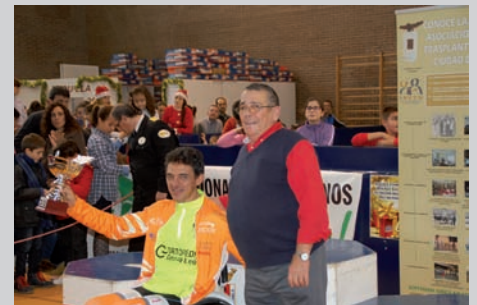
1º clasificado en silla de ruedas.