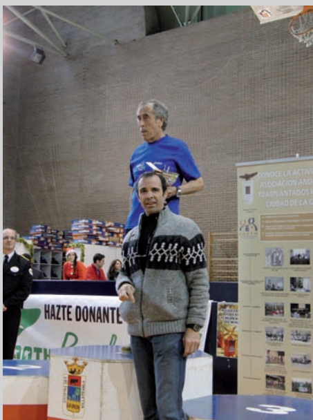
Corredor más veterano (77 años)