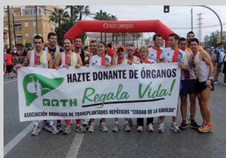
Club Deportivo Palaciego