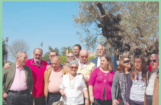
Grupo de socios asistentes al acto.