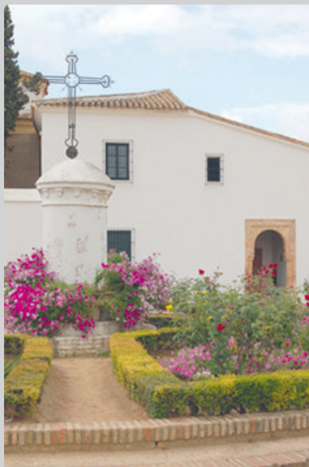
Monasterio de la Rábida (Huelva)