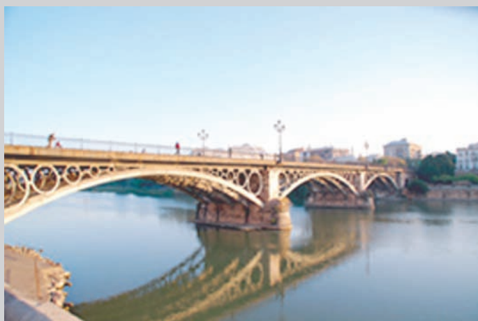
Puente de Isabel II conocido popularmente como Puente de Triana.