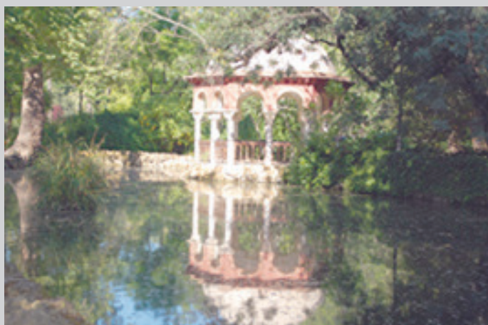
Pabellón de Alfonso XII donde cuentan que el Rey declaró su amor a M a de las Mercedes