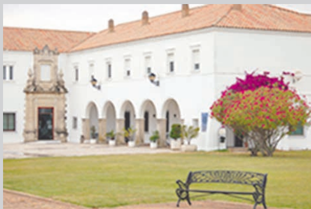
Monasterio la Rábida (Huelva)