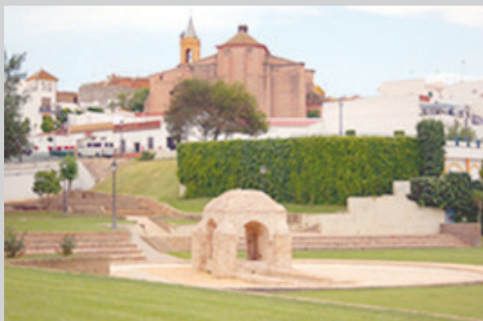
Iglesia S. Jorge Mártir ( Palos Fra.)