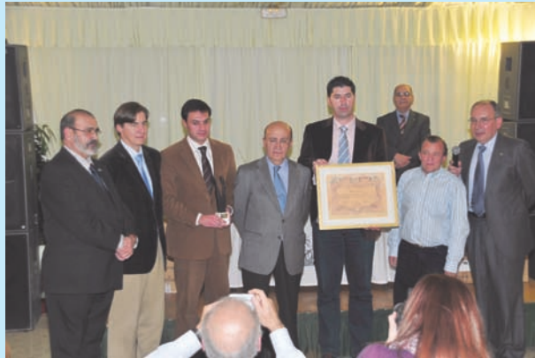
Premio Dr. Angel Bernardos al pueblo de El Viso del Alcor