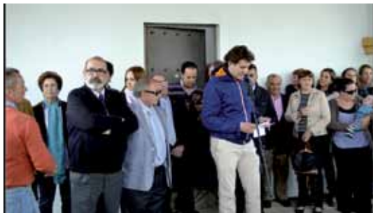
El Alcalde, Curro Godoy dirigiéndose a los presentes