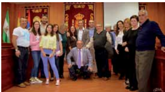
El Alcalde y la Delegada de Sanidad junto a los participantes en el Acto

El acto, muy emotivo, concluyó con la actuación de la chirigota palaciega "Marte y los Trece" que dedicó un tema a un joven donante de órganos de la localidad.