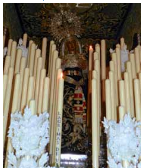
Virgen de las Angustias-Patrona de los Donantes