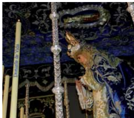
Virgen de la Hiniesta