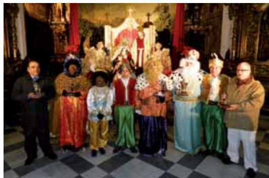
Los premiados con los Reyes Magos y sus pajes