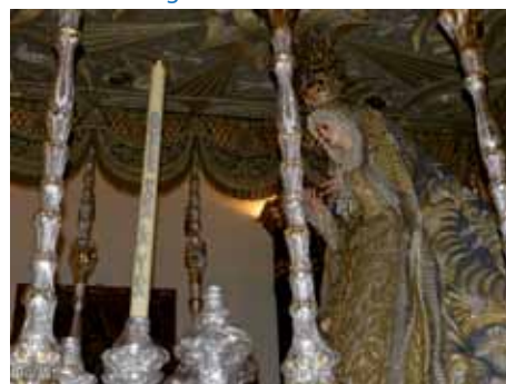
Virgen de los Ángeles