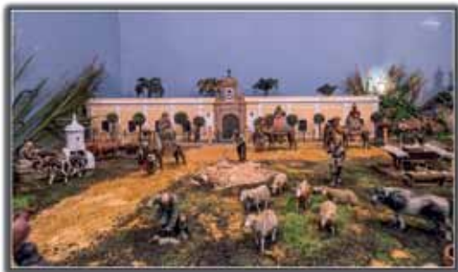
Maqueta de la Fábrica de Artillería