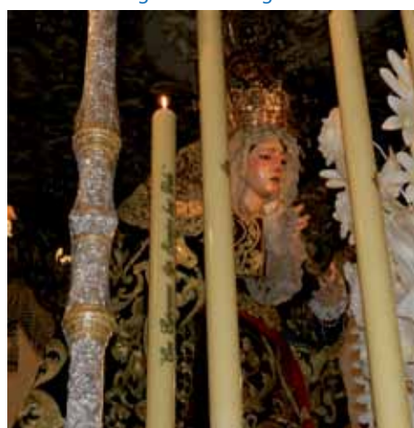
Esperanza de la Trinidad