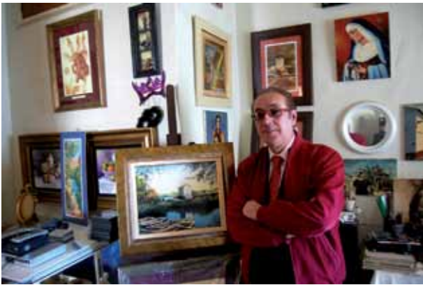
El pintor en su estudio