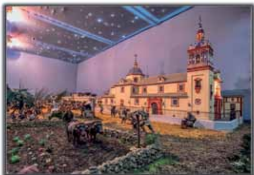
Maqueta de la Iglesia de San Bernardo