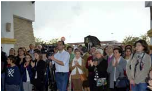
Asistentes a la inauguración de la Rotonda