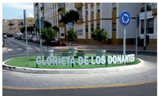
Rota septiembre 2018