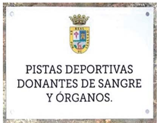
Real de la Jara 7 agosto 2018