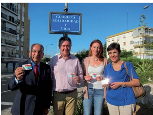
Sevilla Distrito Macarena 11 julio 2018