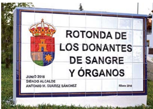
Valencina de la Concepción 27 junio 2018