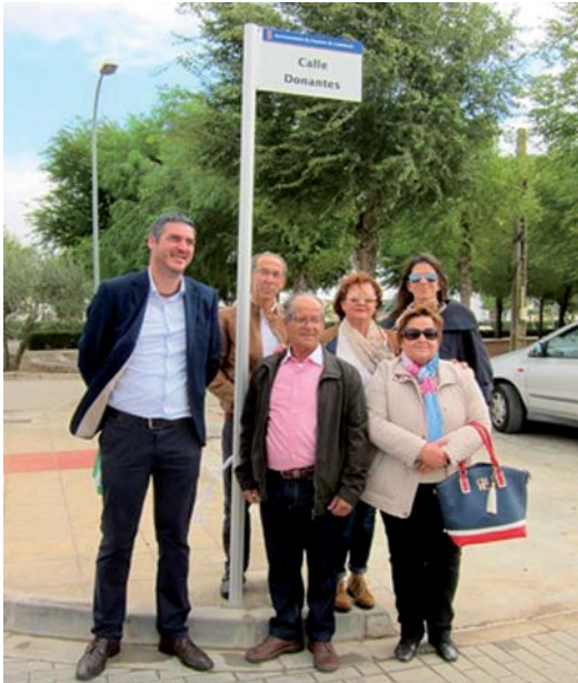
Descubrieron el rótulo dos donantes vivos y trasplantados de Fuentes