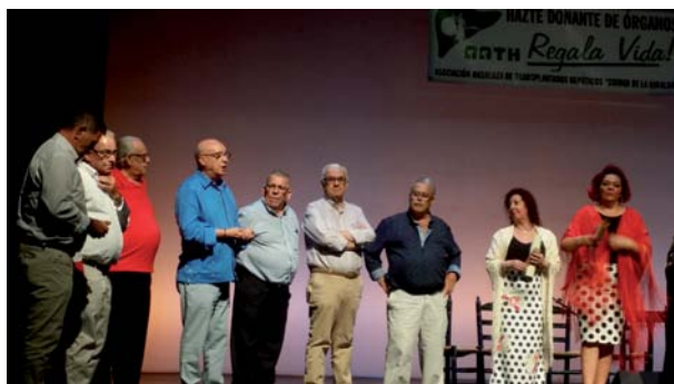
Nuestro presidente junto a socios trasplantados se dirige al público asistente