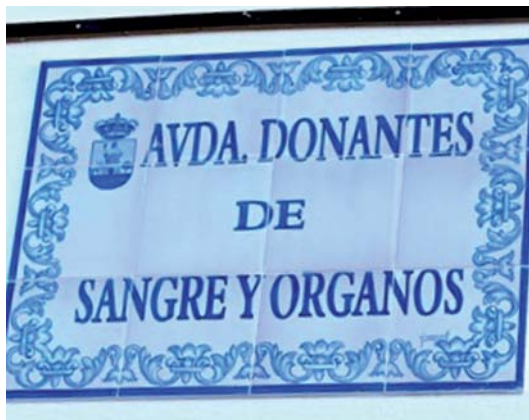
Aznalcóllar 28 junio 2018