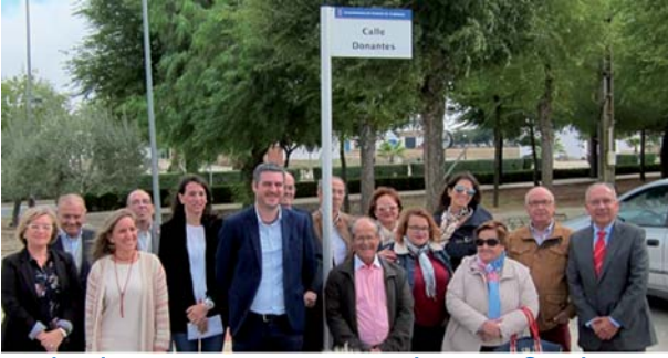
Todos los participantes en el acto oficial junto al Alcalde de Fuentes